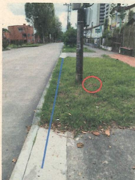
Distancia entre el daño y la canalización red de acueducto.