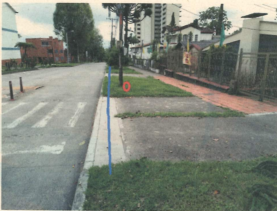
Línea Azul, tubería instalada, círculo rojo daño en la acometida. La franja de pavimento nuevo indica el ancho intervenido