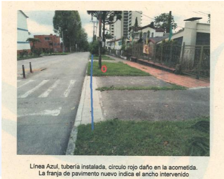
Línea Azul, tubería instalada, círculo rojo daño en la acometida. La franja de pavimento nuevo indica el ancho intervenido

debido a que esta canalización no se hizo encima de la acometida eléctrica, la canalización se efectuó aproximadamente a escaso uno (1) m de distancia, además de haberse intervenido esta acometida los obreros hubiesen sufrido un percance, situación que nunca se presentó.