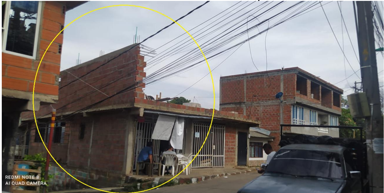
Carrera 93 con Calle 2 Oeste B/ Alto Jordán – Predio del supuesto. Foto 2021. No. 1

Sobre las distancias de seguridad. De acuerdo a las medidas tomadas en el sitio, referidas a distancias de seguridad respecto a las redes de media tensión, se puede observar claramente que el inmueble corresponde a una edificación de Dos (02) pisos en construcción, con salientes en plancha y pared del segundo (2º) piso, quedando con una distancia desde la fachada superior del 2º piso, donde se levanta una pared o muro a 1.20 mts a la red de energía más cercana, disminuyendo la distancia de seguridad establecida por el Reglamento técnico de Instalaciones eléctricas RETIE. (Ver registro Grafico siguiente.)