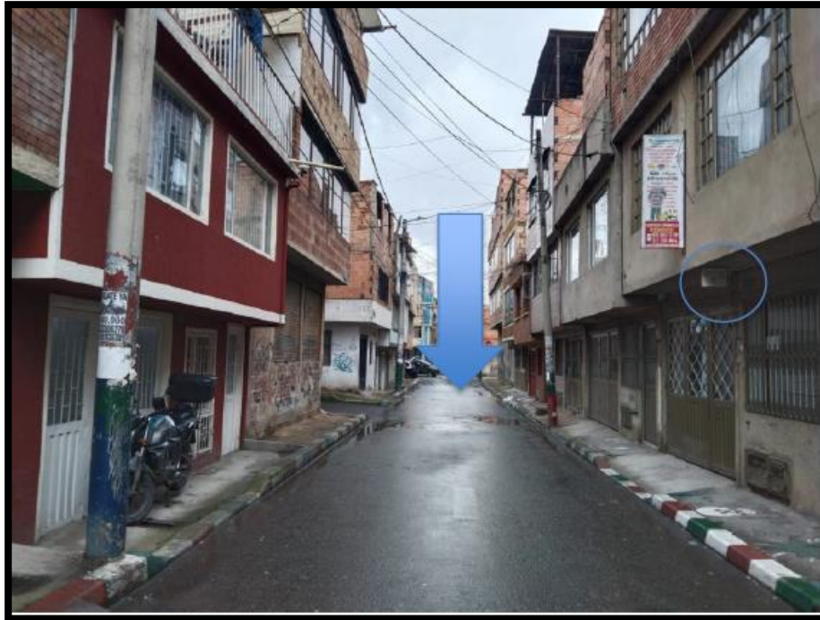
IMAGEN No 4: Se observa el lugar de residencia del conductor ubicado en la calle 74ª No. 78-33, bosa Carbonel, mediante la herramienta Google Maps.

IMAGEN No. 3: Se observa el lugar de los hechos ubicado en la carrera 87D bis No. 51 sur, bosa Brasil, con la flecha se señala el lugar del hurto, así mismo se indica las cámaras halladas y las cuales probablemente captaron la ocurrencia.