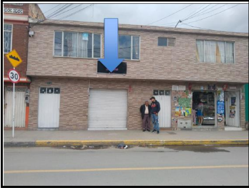
IMAGEN No 7: Se observa el lugar donde el rodante asegurado era estacionado