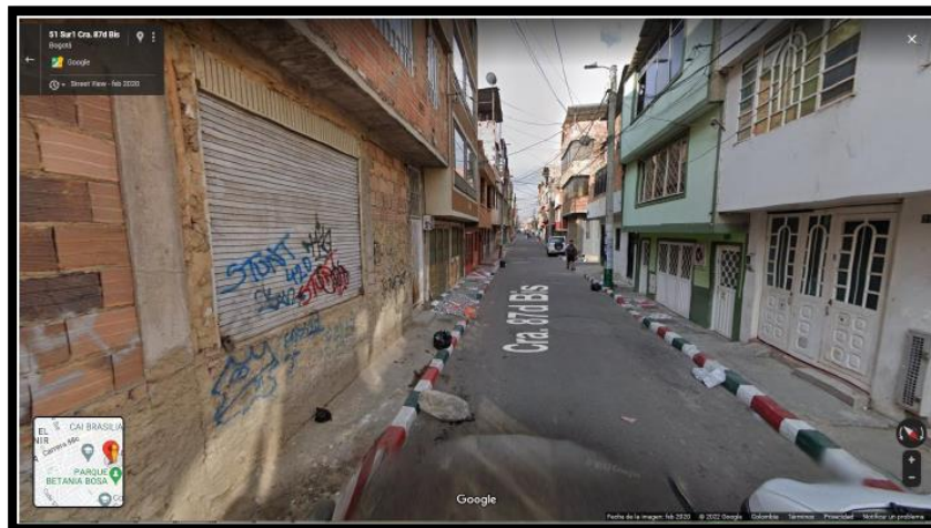
IMAGEN No. 2: Se observa el lugar de los hechos ubicado en la carrera 87D bis No. 51 sur, bosa Brasil, con la flecha se señala el lugar del hurto.

IMAGEN No.1: Se observa el lugar de los hechos ubicado en la carrera 87D bis No. 51 sur, bosa Brasil, mediante la herramienta Google Maps.