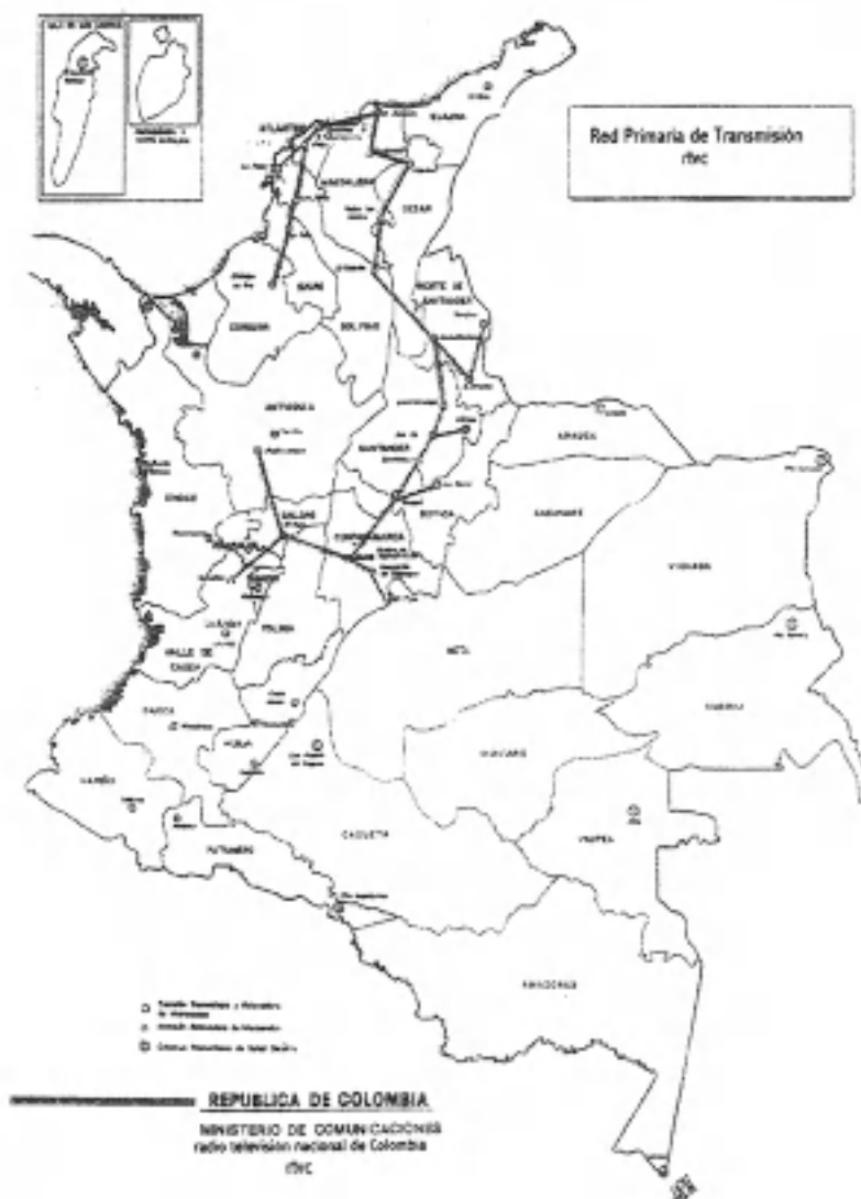
Grafica 1. POSICIÓN DE ALGUNAS ESTACIONES DE LA RED PRIMARIA