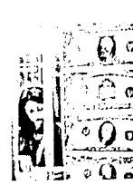
LAS CASAS DE CAMBIO ya están cobrando el impuesto