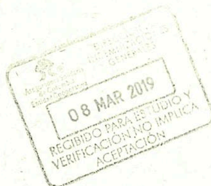
Gerente de Clientes

La presente certificación se expide a solicitud del interesado a los 05 días del mes de Marzo de 2019.