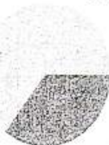
Resumen de mi cuenta de ahorro individual a lo largo de mi vida laboral