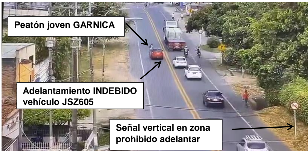
Imagen No. 2