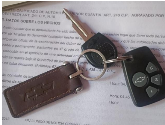
Imagen 11. Fotografía del juego de llaves en poder del asegurado.

Imagen 8, 9 y 10. Fotografías del domicilio del asegurado y del lugar de estacionamiento cotidiano del vehículo.