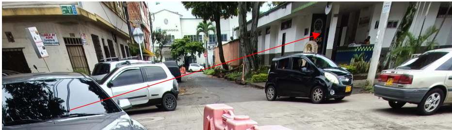
Imagen 22. Estación De Policía Junín.